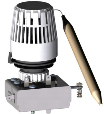
ZW 4 Aquastat

Pour unlock, le levier de sécurité est tiré en position supérieure et encliqueté en place. Veuillez noter que le sonde de contact doit être plus froid que la température limite régler.